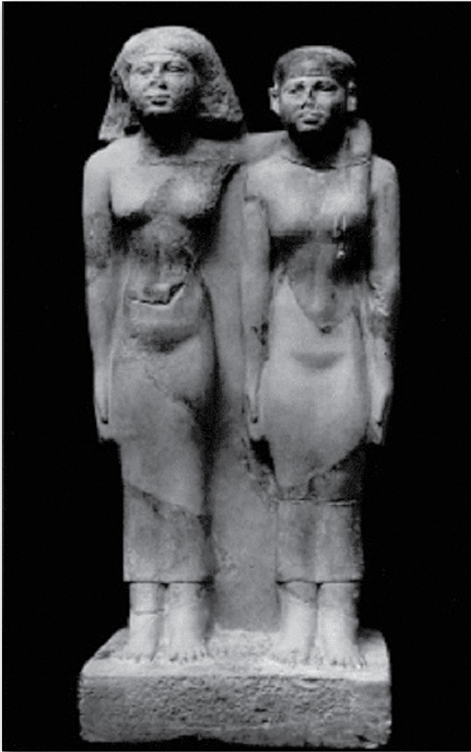
3. kép II. Hotepheresz és III. Mereszanh a G7530Sub-ból származó kisméretű szobra